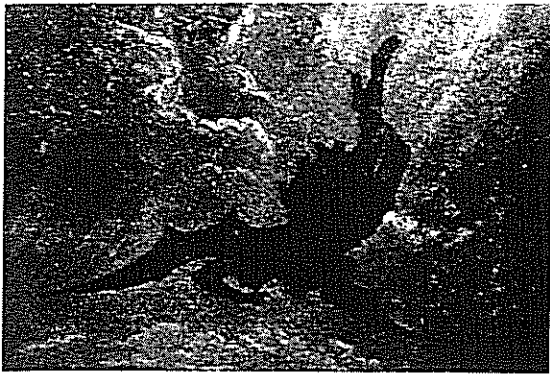
Ci sarà la caduta di satana.

di', ad ogni palpito del tuo cuore: "Vieni, Signore Gesù"".