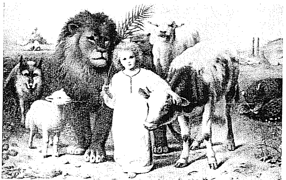
Il tempo di pace.

"Nel mio breve regno sul mondo sarò Io che regnerò, Io e i resti del mio popolo, ossia i fedeli veri, quelli che non hanno rinnegato Cristo e ricoperto il segno di Cristo con la tiara di Satana. Cadranno allora le bugiarde deità dello strapotere, le dottrine oscene rinneganti Iddio, Signore onnipotente. La mia Chiesa, prima che l'ora del mondo cessi, avrà il suo fulgido trionfo. Nulla è diverso nella vita del Corpo Mistico di quanto fu nella vita del Cristo. Vi sarà l'osanna alla vigilia della Passione, l'osanna quando i popoli presi dal fascino della Divinità, piegheranno il ginocchio davanti al Signore. Poi verrà la Passione della mia Chiesa militante, ed infine la gloria della Risurrezione